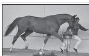
PATOUCHE DE SAINT-AUBERT